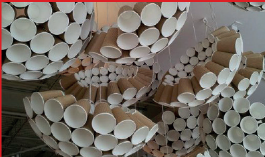
Kaffekoppar.. Eller början till en snygg lampa?

Vad är det egentligen som är skräp? Och vem bestämmer det? Material har som allt annat inget värde i sig, utan får det först när vi människor ger det värde. Fantasilöshet skapar mer och mer sopor i världen, men tänk om vi istället skulle hitta fler användningsområden för våra sopor? Barn & ungdomar har ofta mer fantasi och idérikedom än vuxna som kanske fastnat i gamla mönster. Därför vill vi uppmuntra er i åk 6-8! att göra det mesta och det bästa av er fantasi och släppa loss era inre designers!